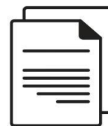
Документ для поддержки

Настоящее Руководство пользователя записано на сам жесткий диск. Рекомендуем создать резервную копию Руководства пользователя на компакт-диске или локальном жестком диске сразу же после подготовки этого диска к работе.