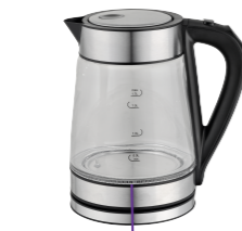
Круговой LED индикатор